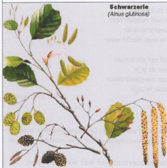
Schwarzerle ( Alnus glutinosa )

Elzenhout, zo nauw verwant met water, is geschikt hout voor een wichelroede om bronnen op te sporen.