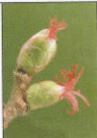
Piepkleine vrouwelijke bloem met alleen rode stampertjes die later uitgroeien tot ....