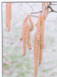
Mannelijke katjes met stuifmeel