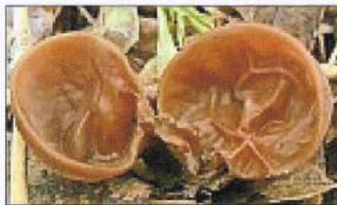
Judasoor is eetbaar en wordt veel gebruikt in Chinese en Japanse keuken.